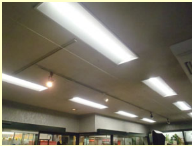
点灯時間の長い照明をLEDに