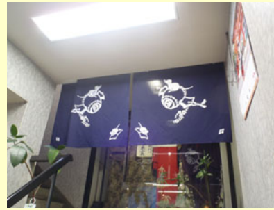
「のれん」の設置で暖房効率向上