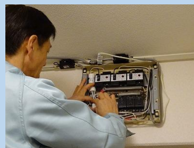
取り付けは20分程度