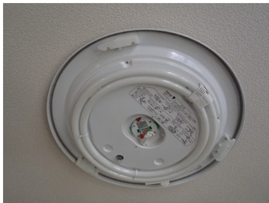
カバーを外した状態