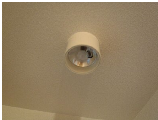
照明全体（天井に取り付け）