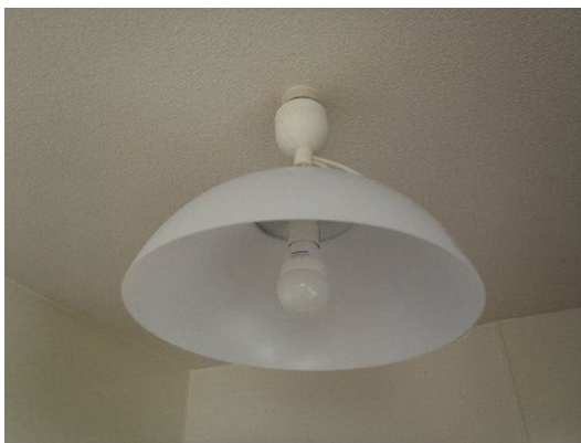
照明全体（電球型の場合）