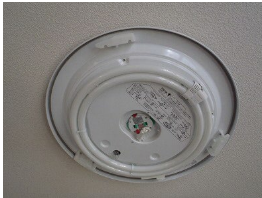
カバーを外した状態