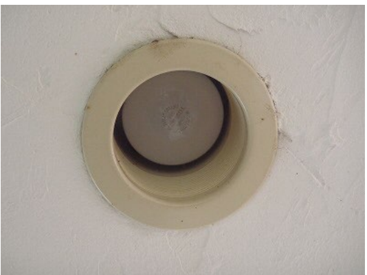
照明全体（ダウンライト）