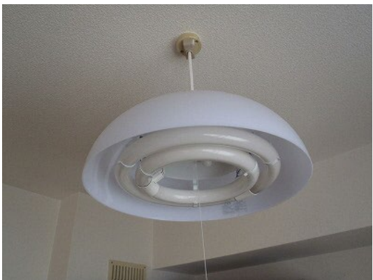
照明全体（丸型の場合）