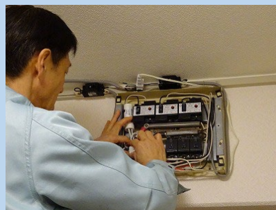
取り付けは 30 分程度

※分電盤の状況により、省エネメーターを設置できない場合や正しい数値を得られない場合があります。